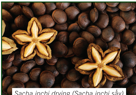
Sacha inchi drying (Sacha inchi sấy)