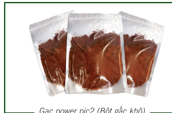
Gac power pic2 (Bột gấc khô)