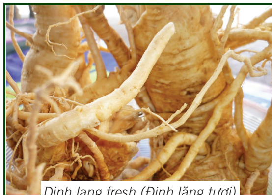
Dinh lang fresh (Đinh lăng tươi)

Currently, Agri365 is supplying products from Sacha inchi seeds from raw materials (fresh seeds) to finished products (roasted salt sacha inchi seeds and inchi oil).