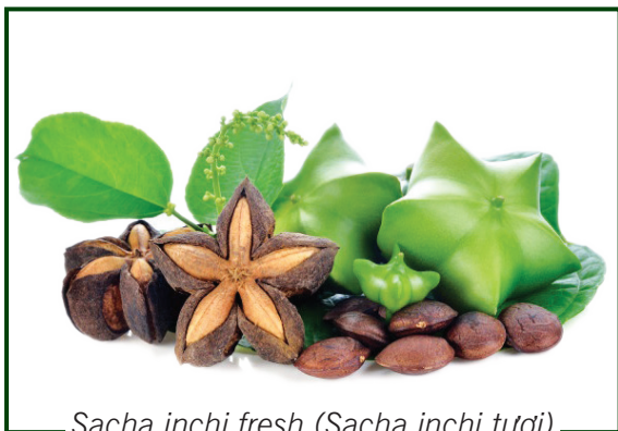
Sacha inchi fresh (Sacha inchi tươi)

Hiện tại, Agri365 đang cung cấp các sản phẩm từ hạt Sacha inchi từ nguyên liệu (hạt tươi) đến thành phẩm (hạt sacha inchi rang muối, dầu sacha inchi).