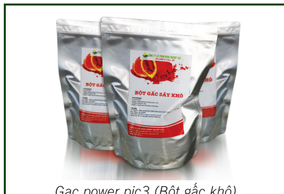
Gac power pic3 (Bột gấc khô)

Dầu gấc được đựng trong túi chân không với các trọng lượng 500ml, 1l, 5l, hoặc theo yêu cầu của khách hàng.