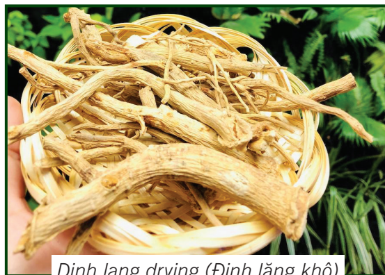
Dinh lang drying (Đinh lăng khô)