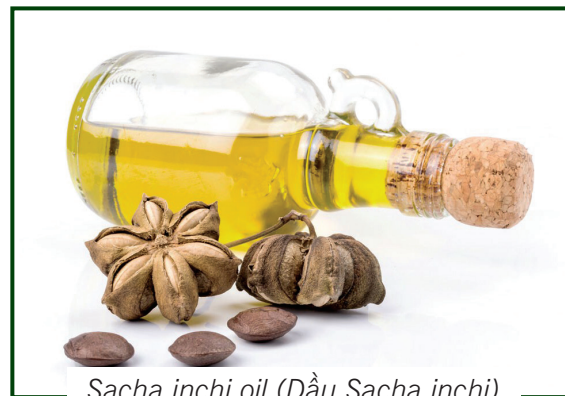
Sacha inchi oil (Dầu Sacha inchi)