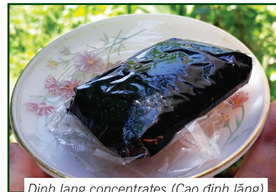
Dinh lang concentrates (Cao dinh lăng)