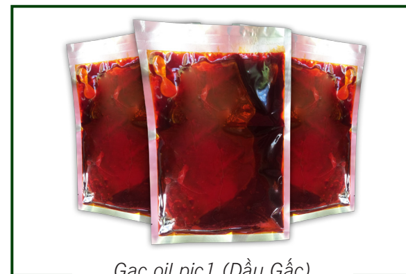
Gac oil pic1 (Dầu Gấc)