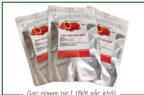
Gac power pic1 (Bột gấc khô)

Gac oil is standing in a vacuum bag with the weight of 500ml, 1l, 5l, or according to customers' requirements.