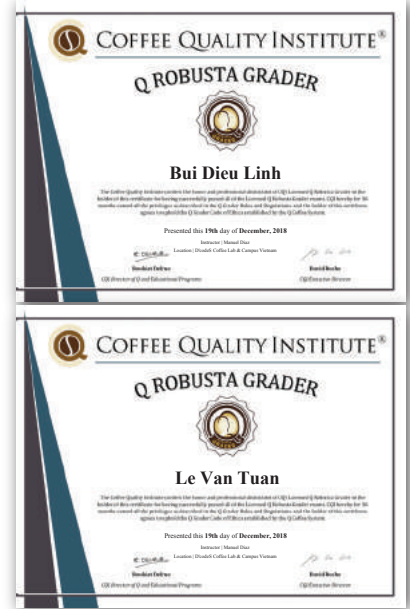
Chứng nhận Q Robusta Grader