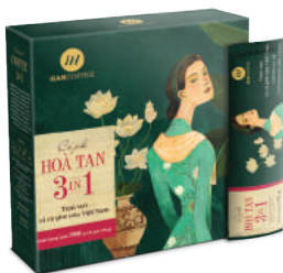
HANCOFFEE cà phê hòa tan

Sản phẩm được làm từ những hạt cà phê tuyển chọn của vùng cà phê trứ danh Cầu Đất, Lâm Đồng nhằm đáp ứng gu thưởng thức tiện lợi, nhanh chóng và vẫn đầy tinh tinh tế của những tín đồ yêu cà phê. HANCOFFEE túi lọc, sản phẩm sáng tạo mang lại trải nghiệm thưởng thức cà phê thú vị, mới mẻ, đặc biệt khi được tự mình pha một ly cà phê rang xay nguyên chất, thơm ngon chỉ trong vòng 02 phút.