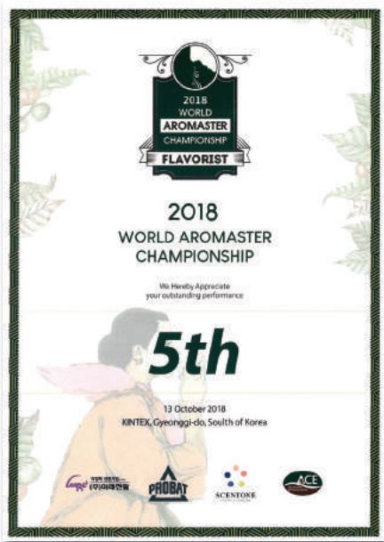
Top 5 cuộc thi World Aromaster Championship 2018

Đội ngũ của IDD là những người có kinh nghiệm, đạt nhiều thành tựu trong nước & Quốc tế: Là những người trẻ nhiệt huyết, có chung niềm đam mê và khát vọng với cây cà phê. Chuyên viên R&D của HANCOFFEE đã đạt được nhiều thành công trên các đấu trường trong nước và Quốc tế.