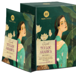
HANCOFFEE Cà phê túi lọc

Sản phẩm được làm từ những hạt cà phê tuyển chọn của vùng cà phê trứ danh Cầu Đất, Lâm Đồng nhằm đáp ứng gu thưởng thức tiện lợi, nhanh chóng và vẫn đầy tinh tinh tế của những tín đồ yêu cà phê. HANCOFFEE túi lọc, sản phẩm sáng tạo mang lại trải nghiệm thưởng thức cà phê thú vị, mới mẻ, đặc biệt khi được tự mình pha một ly cà phê rang xay nguyên chất, thơm ngon chỉ trong vòng 02 phút.