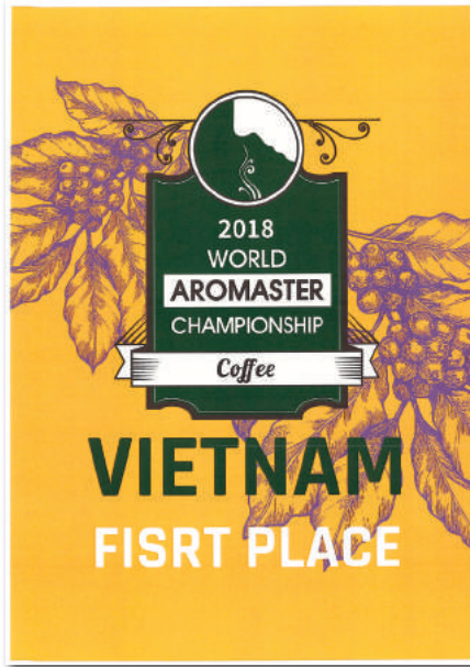
Chứng nhận quán quân cuộc thi Aromaster khu vực phía bắc