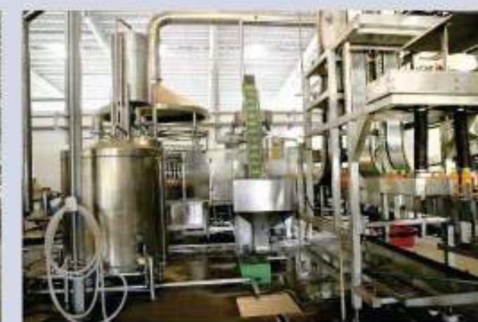
HỆ THỐNG MÁY CHIẾT CHAI PET (Công suất 36.000 chai/giờ) Extraction system (Capacity 36.000 bottles per hour)