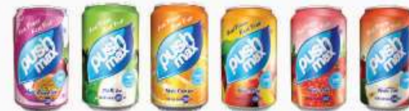
Chanh leo Trà Bí Đao Cam ép Nước Đào Nước Dâu Nước Táo Passion fruit Winter melon tea Orange Peach Strawberry Apple

Lon nhôm: 330 ml - Aluminium Can: 330 ml