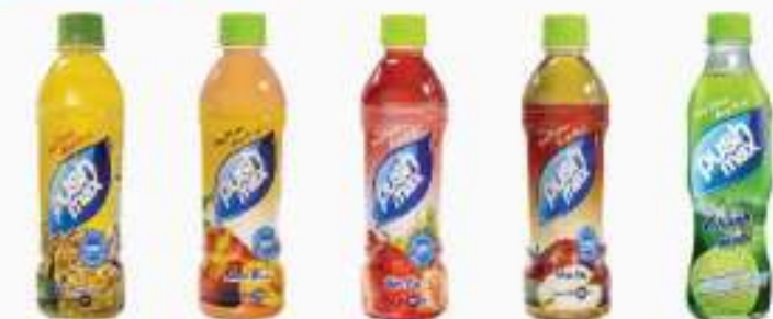
Chanh leo Nước Đào Nước Dâu Nước Táo Chanh muối Passion fruit Peach Strawberry Apple Salted Lemon