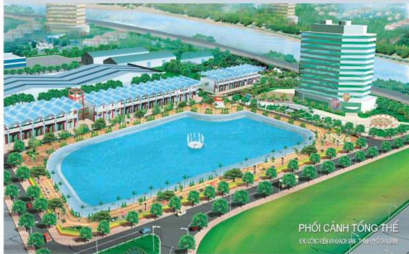
PHỐI CẢNH TỔNG THỂ Khu Công Viên và Khách Sạn - Thành Phố Thái Bình

Ty Diều lake project and 5 stars hotel with 18 floors combined with a commercial center