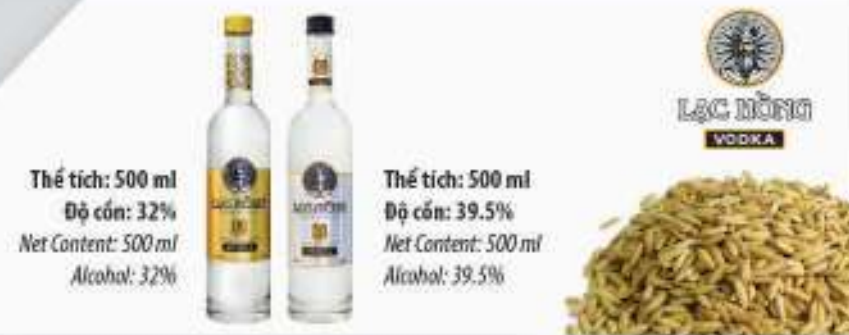
Thể tích: 500 ml Độ cồn: 32% Net Content: 500 ml Alcohol: 32%

Ingredients: Fermented rice and purified water. Manual: More delicious with cold drink. Preserved in dry and well ventilated cool places. Avoid direct contact with heat or sunlight.