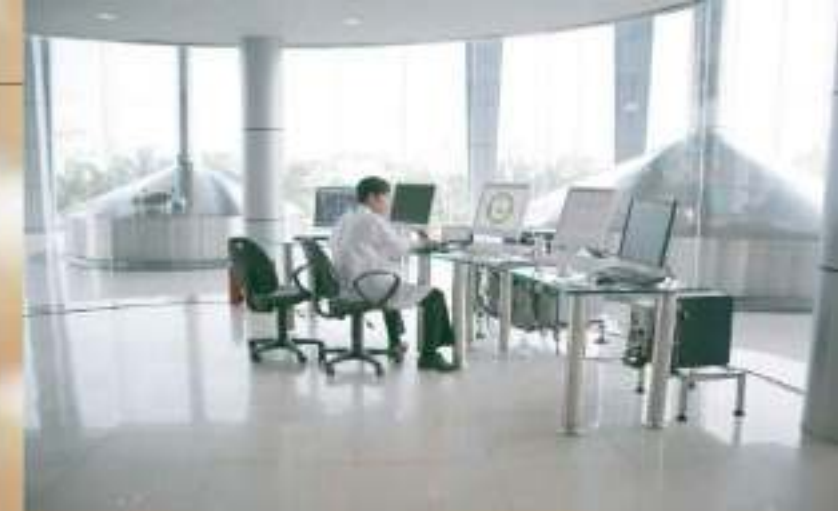
Trung tâm điều khiển Nhà máy. Controlling center of brewery.

As: winter melon, orange juice, cola, passion fruit, energy drink. The most special product is Dai Viet Black Beer in bottle and can which was the first Black Beer produced in Viet Nam. The taste of the Beer is created by the combination of the leading brew masters of Germany and Vietnamese experienced brew masters bringing about the high quality of Dai Viet Beer.