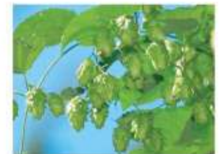
Hoa bia tuyệt hảo Fine bitterness