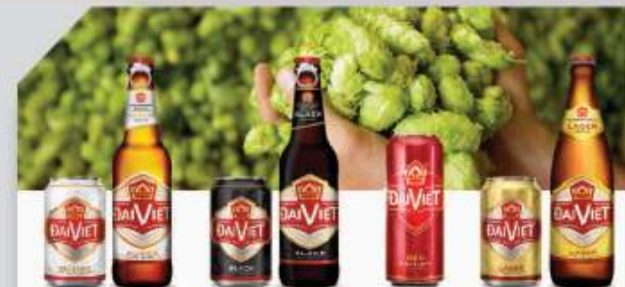
Dai Viet Pilsner/Super Dai Viet Pilsner/Super Độ cồn: 5% thể tích. Alcohol: 5%

Ingredients: Malt, hops, purified water. Manual: More delicious with cold drink. Preserved in dry and well ventilated cool places. Avoid direct contact with heat or sunlight.