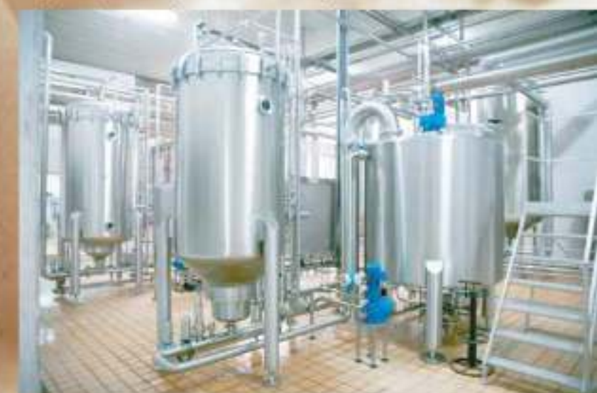
Hệ thống lọc bia do Filtrox - Thụy Sĩ cung cấp. Filtration system supplied by Filtrox Switzerland.