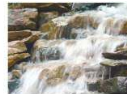
Nước tinh khiết Purified water