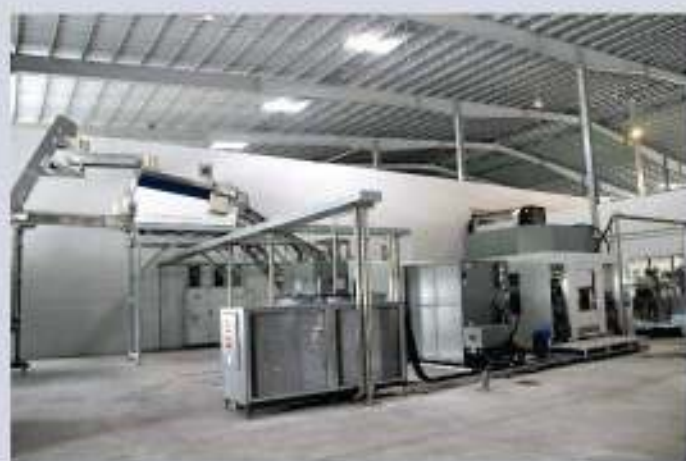
HỆ THỐNG MÁY THỐI CHAI NHỰA (Công suất 24.000 chai/giờ) Plastic bottle manufacturing system (Capacity 24.000 bottles per hour)

The factory was set up with the most advanced and modern automated technology of the U.S and Germany. The current capacity has reached 100 million liters per year (40% can and 60% PET Bottle). The capacity can be easily expanded to 200 million liters per year or more because the factory is located on an area of more than 28 thousand square meters within the Tam Quang industrial zone (390 thousand square meters) which has been allocated to Hương Sen Group to manage, invest and exploit by the Thai Binh Provincial government's decision.