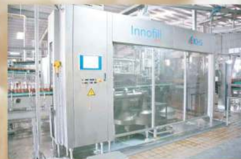
Hệ thống chiết chai công suất 30.000 chai/giờ do Tập đoàn KHS - Đức cung cấp. Bottles filling line capacity of 30.000 bottles/hour, supplied by KHS Corporation - Germany.