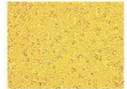
Men thuần chủng Yeast