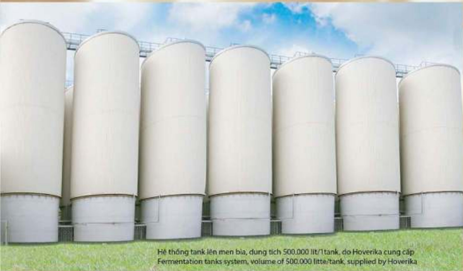
Hệ thống tank lên men bia, dung tích 500.000 lít/tank, do Hoverika cung cấp Fermentation tanks system, volume of 500.000 litre/tank, supplied by Hoverika

Bia Đại Việt được sản xuất trên dây chuyền hiện đại tiên tiến nhất của CHLB Đức, do các hãng hàng đầu thế giới cung cấp như: Huppman, Krones, Steinecker, filtrox, WTC Ecilmaster(USA), Mycom ... với công suất 200 triệu lít/năm.