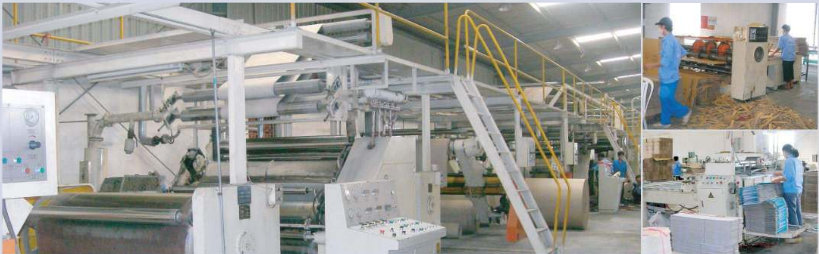
Dây chuyền sóng carton 5 lớp, công suất 150m/1 phút Wave carton line 5 coats, capacity of 150m/minute

The company has also set up a team of specialists, who have enough skills and experiences to consult and design templates that meet the clients' demand with the highest quality.